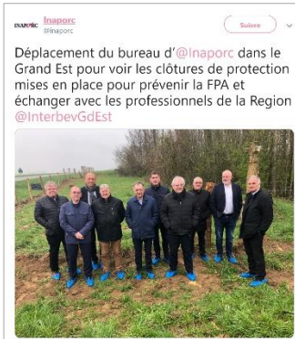
Déplacement du bureau d'Inaporc pour voir les clôtures de protection pour prévenir la PPA 13 RTs – 23 likes