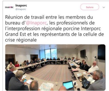
Réunion de travail 8 RTs – 13 likes